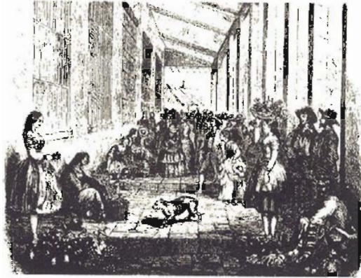
DOS VISTAS DEL MERCADO Y TIANGUE BAJO LAS ARCADAS GRANADINAS

"VEREMOS UN NUEVO TORRENTE DE EMIGRANTES..." (p.52)