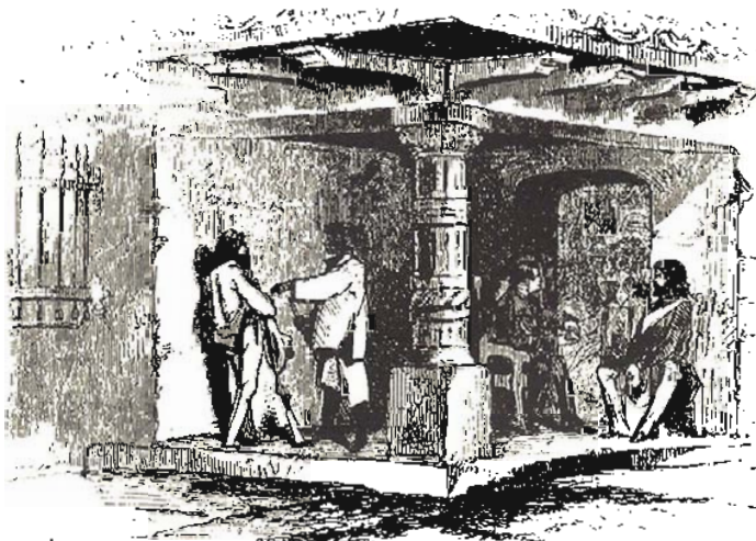
A TALK WITH SEÑOR ZEPAYÁ.

FILIBUSTEROS EN UNA CASONA SOLARIEGA NATIVA