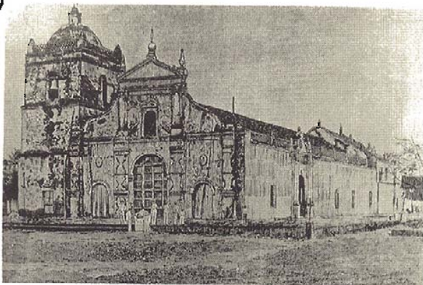
PARROQUIA DE MASAYA