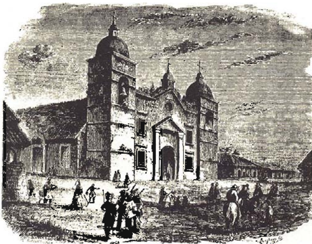
PARROQUIA DE GRANADA