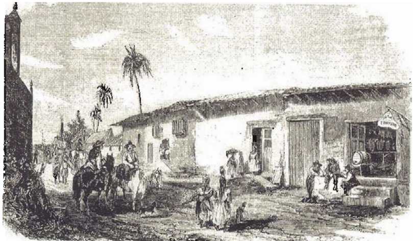
CALLE DE GRANADA POR DONDE ENTRABAN LOS INMIGRANTES

Se permite la reproducción sólo para estudios académicos sin fines de lucro, y citando la fuente - FEB